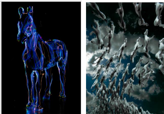
Axel Voss, „Herrscher/Untertan“, 70 cm x 100 cm, Siebdruck, 2015