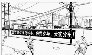
Axel Voss, „Freund/Freund“, 70 cm x 100 cm, Siebdruck, 2015